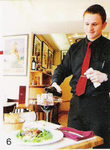
6.フレンドリーなサービスは、心からホッとできる 7.注文を受けてから焼きあげる、温かいフォンダンショコラ バニラアイス添え1200円。生地の中からは、とろけるバターなチョコレートが